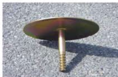
Option : fixation par platine anti- arrachement