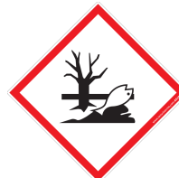
Tableau des déclinaisons possibles